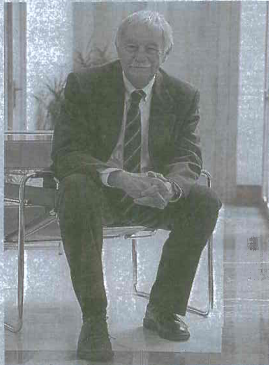
Mendoza abrió ayer las conferencias en Villa Suso.

Tampoco es que sea un testigo muy fiable de la transformación de Vitoria, porque siempre que vengo veo lo mejor. No he visto las partes malas de la ciudad, que seguro que las tiene. Pero el cambio ha sido tremendo; las ciudades pueden cambiar de aspecto sin hacerlo físicamente. Y Vitoria es un caso de una ciudad que quizá pasaba inadvertida, pese a ser cómoda y agradable, y que ha pasado a resul-