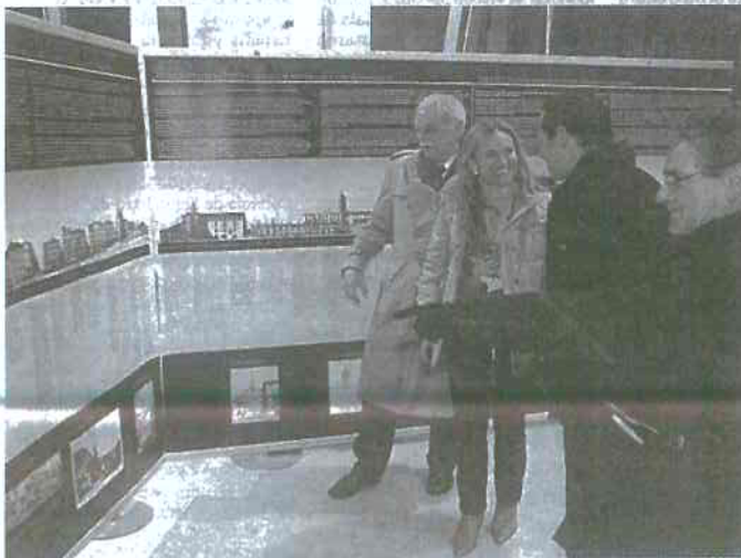
La exposición sobre las plazas de Vitoria, La Habana y Montevideo, en la Catedral Vieja.

Lazcoz defiende que la revitalización de una zona centro no se puede quedar en lograr una postal, "sin personas"